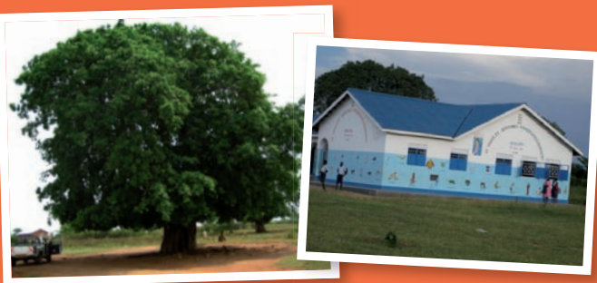
BAUM DES LEBENS: Hier hat früher die hl. Messe, der Schulunterricht und der Kindergarten stattgefunden.

Unser Logo symbolisiert den Grundgedanken von Herz zu Herz. Zwei Menschen reichen sich die Hand zur Freund- und Partnerschaft, für gemeinsame Ziele: Hunger vermeiden, Hilfe zur Selbsthilfe fordern und fördern, Menschlichkeit und Glauben vorleben.